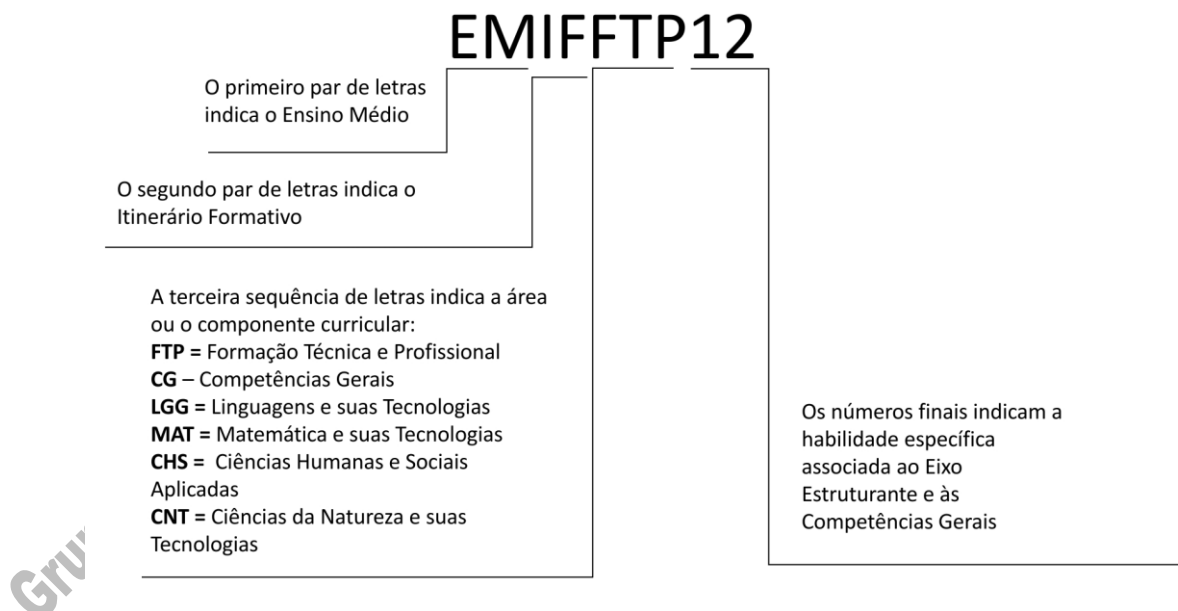
Gráfico explicativo do Código de Habilidade da Formação Técnica Profissional – FTP

A distribuição das habilidades indicadas acima ocorre em conformidade com a correlação entre estas habilidades e as atribuições empreendedoras, apresentada nos Componentes Curriculares em que as atribuições correlatas forem alocadas, cumprindo, dessa forma, a função prevista pelos Eixos Estruturantes.